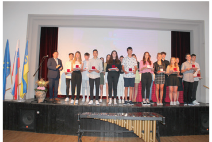
Sprejem najboljših učencev OŠ Beltinci in POŠ Dokležovje pri županu Občine Beltinci