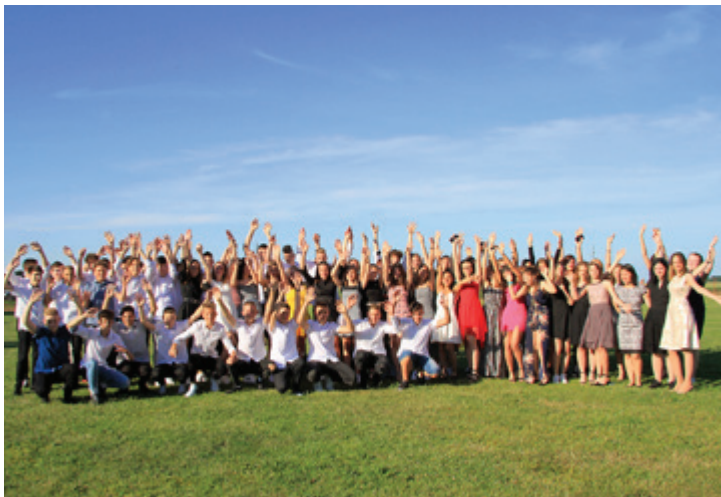
Valeta devetošolcev OŠ Beltinci