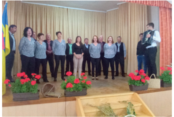
Obeležitev dneva državnosti v Melincih