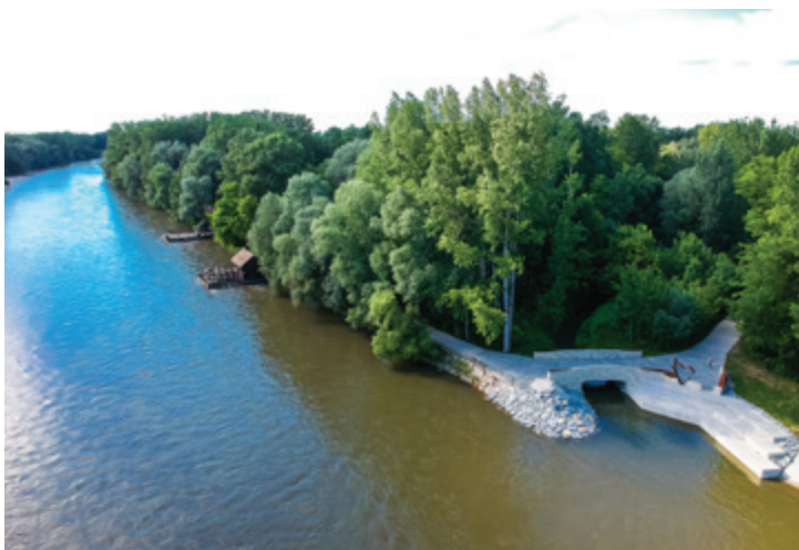
Od letos na Otok ljubezni po novem mostu