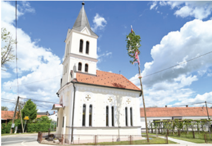
101. majoš v Gančanih je bil postavljen na mestu kot 1. majoš leta 1919